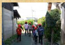
まちの安全をチェックする「まちあるき」