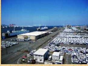
日本を代表する自動車 港湾 三河港