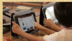
タブレット端末で学習する児童