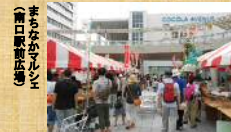
まちなかにぎわい (青口駅前広場)