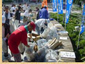
豊橋発祥の市民活動 530運動