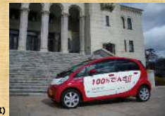
電気自転車(公用車)