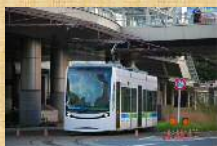
全副座席式路面電車 「DOMI」