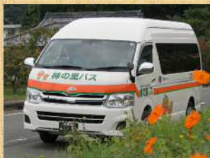
「地域生活」バス・タクシー