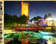
のんびりパーク ナイトガーデン