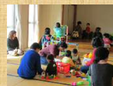
ここにこサークル