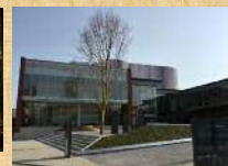
種の日とよはし芸術創造「プラットフォーム」