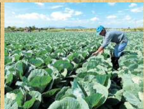
全国有数の産出額を誇る 農業