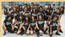
DOMI ええじゃないか後継伝説