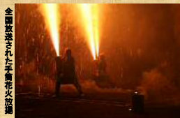
全国放送された 手筒花火放煙