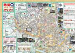
防災コミュニティマップ