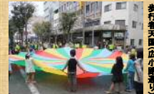
歩行者天国(広小路通)