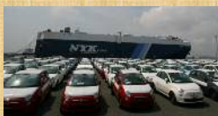
三河港の輸入自動車