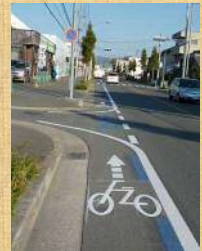
自転車通行空間の整備の様子