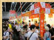
香港での見本市 (香港フードエキスポ)