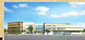
くすのぎ特別支援学校(完成予定図)