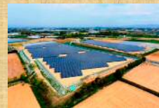
大規模太陽光発電施設 (若津町)