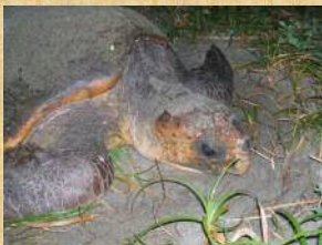
アカウミガメの産卵地 表浜海岸