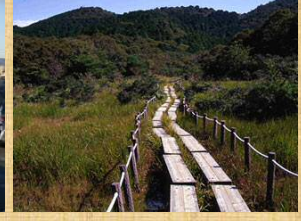
湿地性植物の宝庫 葦毛湿原