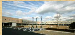
保健所・保健センター(ほいっぶ内)