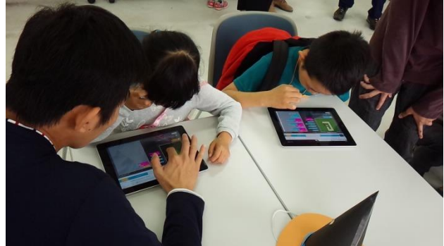
Hour of Code (iPad の場合)