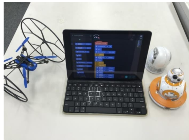
Ticle の例 (iPad 用の教材例)