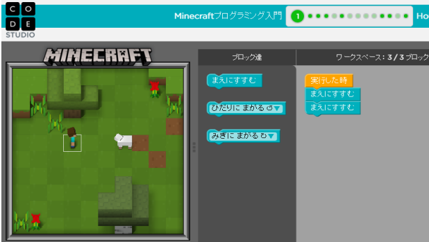
Hour of Code の例

当日、体験できる教材例です。Hour of Codeのような無料のWebサービスをはじめ、Windowsソフトや実習教材、iPadアプリ教材や教材等をご紹介・体験します。Hour of Codeは、全米の公立校で実施されており、日本でも無料で利用可能です。Webブラウザだけで実施可能ですので、先生ご自身が今すぐ費用をかけることなく、貴校PC教室で実施可能です。是非、ご参加の上、体験してみてください。